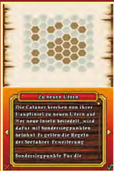
Der Start: Zu Beginn erhalten Sie eine kurze Einführung.