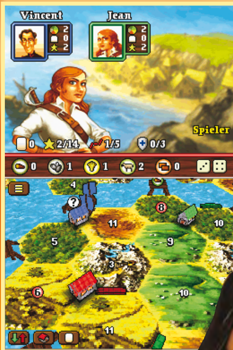
Putzige, aber übersichtliche Optik hilft beim Planen.