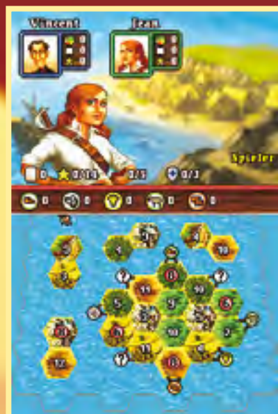
Eine Insel mit zwei Bergen: Holen Sie genug Siegpunkte?

Die unterschiedlichen Aufgaben aus dem Brettspiel und der ersten Erweiterung „Die Seefahrer“ sind komplett im Spiel, weitere Ausbaustufen des Brettspiels haben es hingegen nicht geschafft, mit in die elektronische Variante einprogrammiert zu werden. Wirklich schlimm ist das aber nicht, weil bereits das bestehende Material völlig dafür ausreicht, eine nette halbe Stunde auf den Inseln von Catan zu verbringen – und vielleicht auch ein bisschen mehr. Wer weiß?