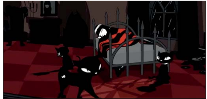
Cutscenes Kurze Animationsfilme begleiten den Spieler in das nächste Level des Spiels und unterstützen die Story und ihre Dramaturgie

um die Spielumgebung zu beleben und das Spielerlebnis zu verstärken. So wurden in Emilys Zimmer etwa das Feuer, Regen und Blitz, der Computer und die Fackel animiert. Da im Falle der Emily-Produktion alles aus einer Hand kam, konnten wir uns den Luxus leisten, flexibel mit neuen Ideen umzugehen und auch vom Originalkonzept abzuweichen. Abschließend wurden sämtliche spielrelevanten Informationen im Level-Editor eingestellt. Dazu gehört, dass begehbare Bereiche definiert, Trigger gesetzt und das Sorting der 3D-Figuren konfiguriert wird.