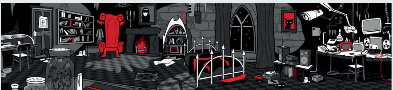
Location Design Emilys Zimmer ist Dreh- und Angelpunkt der Handlung

Zudem lassen sich eine Vielzahl der Animationstools aus Autodesk 3ds Max verwenden, während man beim 2D-Rasterizer nur mit klassischer Spriteanimation arbeiten