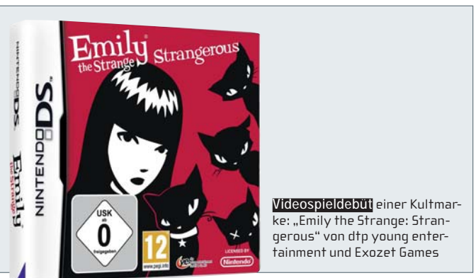
Videospieldebüt einer Kultmarke: „Emily the Strange: Strangerous“ von dtp young entertainment und Exozet Games