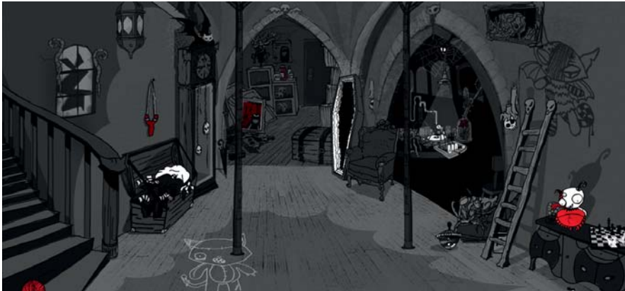
Concept Art Exozets visuelle Vision für die „World of Strange“: Ein Keller ganz nach Emilys Geschmack

kann. Die größere Flexibilität war ausschlaggebend für unsere Entscheidung, Emilys Welt mit dem 3D-Renderer zu realisieren.