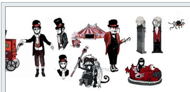
Character Design Exklusiv für das Spiel entwickelte Figuren